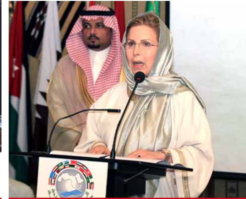
وزيرة السياحة التونسية

عقب ذلك ألقى معالي وزيرة السياحة التونسية سلمى اللومي كلمة أعربت فيها عن سعادتها بتواجدها في المملكة العربية السعودية مقدمة خالص الشكر والتقدير للمملكة حكومة وشعبا على حسن الإستقبال وكرم الضيافة ، منوهة بحجم العلاقات القوية والتاريخية التي تربط المملكة وتونس في مختلف المجالات والمستويات السياسية والإقتصادية والسياحية ، موضحة أن زيارتها للمملكة كأول وجهة ضمن جولتها لبعض الدول الخليجية دلالة على ماتحظى به السوق السعودية من مكانة لدى تونس . كما قدمت شكرها لصاحب السو الملكي الأمير فيصل بن خالد بن عبدالعزيز أمير منطقة عسير رئيس مجلس التنمية السياحية وصاحب السمو الملكي الامير سلطان بن سلمان بن عبد العزيز الرئيس الفخري للمنظمة العربية للسياحة رئيس الهيئة العامة للسياحة والتراث الوطني على دعوتها للمشاركة في حفل تدشين أ بها عاصمة السياحة العربية لعام 2017 والتي تبرهن على ماتوليه أ بها من اهتمام لقطاع السياحة . وأشارت إلى أن القطاع السياحي في تونس من أهم القطاعات التي تحظى باهتمام كبير من الحكومة التونسية وتعتبر محركاً للنمو منذ السنوات الأولى للاستقلال ، مشيرة إلى أن السياحة في تونس تساهم في 12 بالمئة من الناتج المحلي وتوفر 400 ألف وظيفة عمل مباشر أو غير مباشر وتستقطب حوالي 7 مليون سائح في العام، مرجعة هذا النجاح إلى ماتتمتع به تونس من مقومات طبيعية وتاريخية .