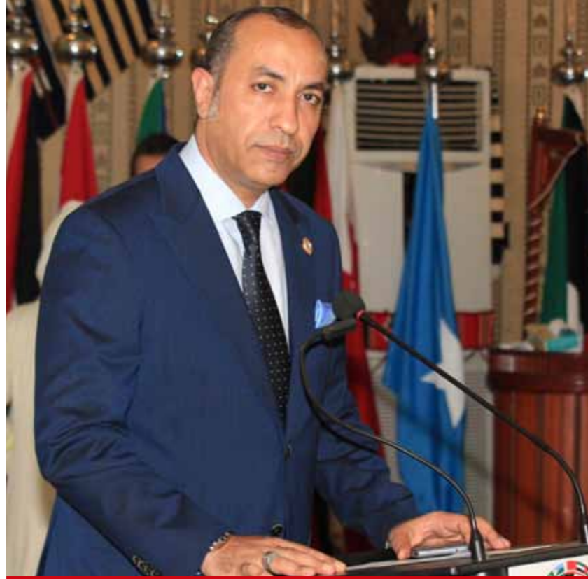
نائب رئيس المنظمة العربية للسياحة