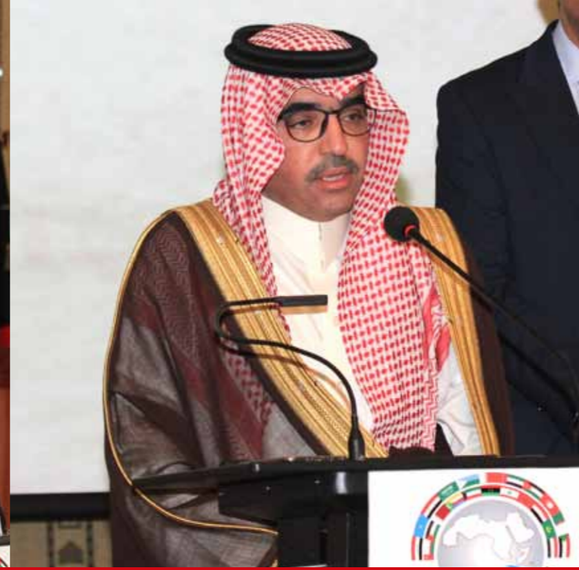
رئيس المنظمة العربية للسياحة